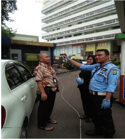
Gambar 1. Pemeriksaan Suhu Tubuh Dan Pemberian Hand Sanitizer