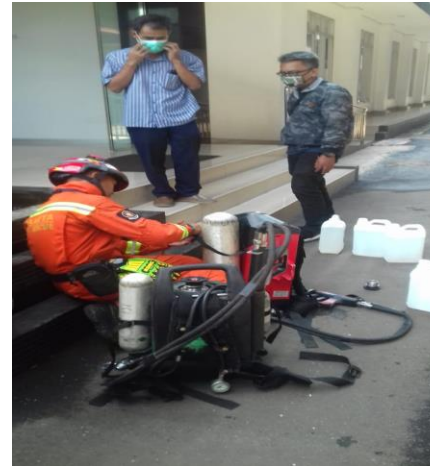
Gambar 3. Penyemprotan Disinfektan di Gedung Kampus