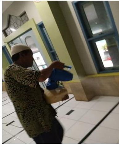
Gambar 2. Penyemprotan Disinfektan di Masjid