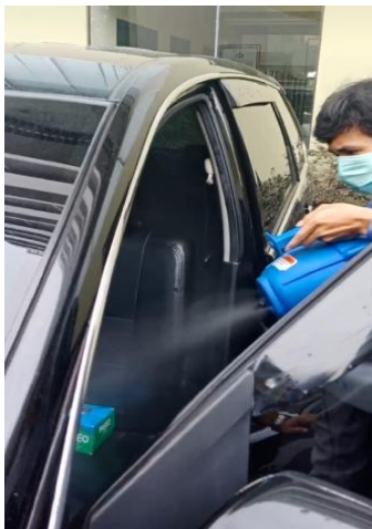
Gambar 4. Penyemprotan Disinfektan Pada Mobil Dinas